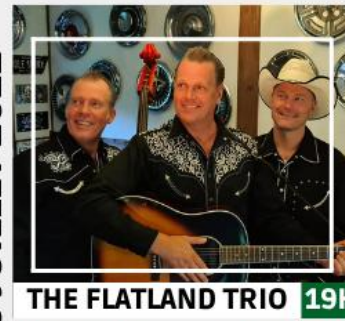
THE FLATLAND TRIO 19H

Ouverture du Festival dans une euphorie totale Country, rock'n roll et vintage pour un hommage aux 60's pleins de surprises!