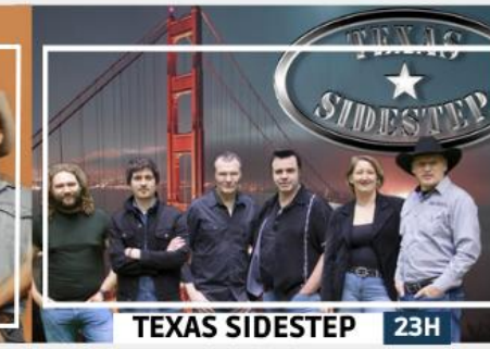
TEXAS SIDESTEP 23H

Le meilleur des Etats-Unis arrive à la fin du mois. Grâce à leur son de funk, rockabilly, blues et outlaw, ils ont été élus pour la troisième fois le groupe local préféré à Las Vegas. C'est sur la scène craponnaise qu'ils vont produire leur premier spectacle en dehors des Etats-Unis.