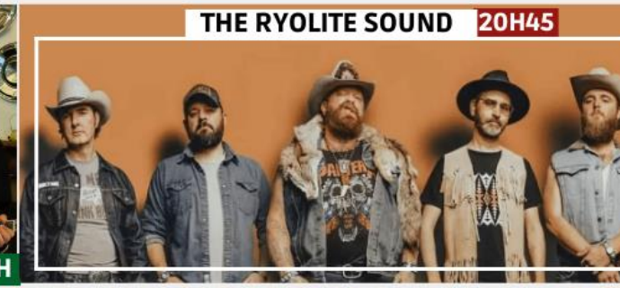
THE RYOLITE SOUND 20H45

Ouverture du Festival dans une euphorie totale Country, rock'n roll et vintage pour un hommage aux 60's pleins de surprises!