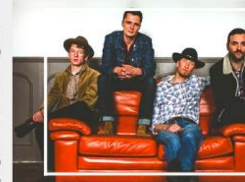
THE SUBWAY COWBOYS 16H

Nous plongerons dans les racines du sud par de l'Honky Tonk "canaille" pouvant filtrer avec le blues, dans la lignée de Johnny Cash et Merle Haggard