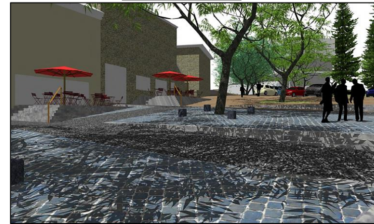
Images de synthèse

Dans la continuité de l'aménagement de la petite vitesse, nous vous informons que les travaux de réfection et d'aménagement de la Place du Marchedial et du jardin public débuteront le 6 avril 2021 pour une période de 8 mois environ. L'entreprise BROC TR qui a été retenue pour mener à bien ces travaux devrait débuter par le bas de la Place au niveau de la maison de retraite St Dominique pour remonter jusqu'au jardin public. Pour tous renseignements complémentaires, vous pourrez vous rapprocher des entreprises en charge du chantier qui seront à votre écoute pendant toute cette période. Nous comptons sur votre compréhension pour les désagréments occasionnés.